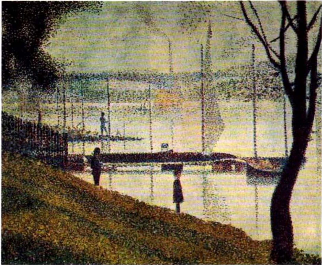
Georges Seurat, Il ponte di Courbevoie

🕒 Osserva questo quadro del pittore Georges Seurat realizzato unendo tanti puntini di diverso colore. Poi rispondi alla domanda e completa.